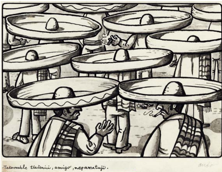
-Takovuhle tlačenici, amigo, nepamatují.