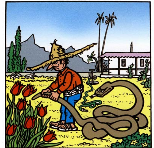
Diablo, kdo opět zavřel rodu?